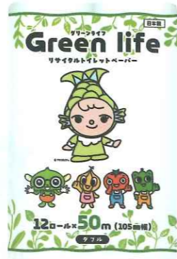
グリーンライフ 50m×12 丸富製紙/国内製造