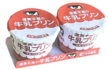
渥美半島の牛乳プリン 冷蔵 180g(90g×2) 中央製乳/国内製造