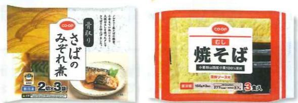
現在、100品以上の商品に生協で回収したPETボトルをプラスチックの一部に使用しています。

日本生協連は、生協で回収したPETボトルをコープ商品のパッケージの原料の一部として再生利用する取り組みを拡大しています。東海コープでもプラスチック環境問題に対する取り組みとして、3生協の店舗でPETボトル回収をし、コープ商品パッケージの原料の一部として再利用する取り組みをすすめています。