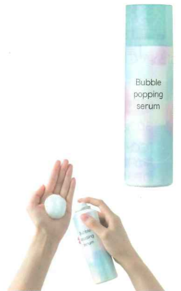
バブルポッピングセラム 120g クラブコスメチェック /国内製造