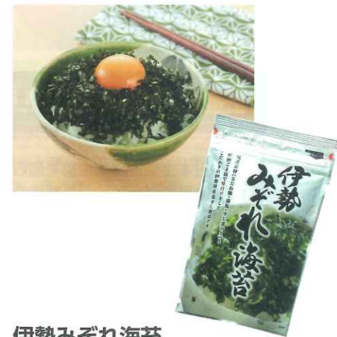
伊勢みぞれ海苔 25g みえぎょれん販売/国内製造